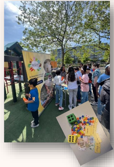
"Jij bent aan Zet"

Stichting MAIT blijft strijden om verandering te brengen in de situatie van kinderen die opgroeien in armoede. Onze inzet is vooral om ook bij de kinderen bewustwording te brengen, op een manier wat bij ze past. Zo laten wij zien dat ze anders naar elkaar gaan kijken, dat ze elkaar helpen, dat ze elkaar niet pesten maar vooral helpen. Om dit voor elkaar te krijgen zetten wij het spel "jij bent aan zet" in maar ook praten we over zakgeld en geven de Monnie training. In gesprek gaan met de jeugd is goed voor hun toekomst en zo leren wij ook wat ze daadwerkelijk nodig hebben. Wij zijn nog steeds partner van Alliantie Kinderarmoede in Nederland waar we mee praten en samen kijken naar oplossingen.