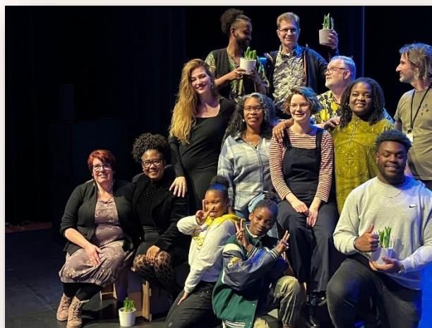
The cast van "Zomaar een straat"